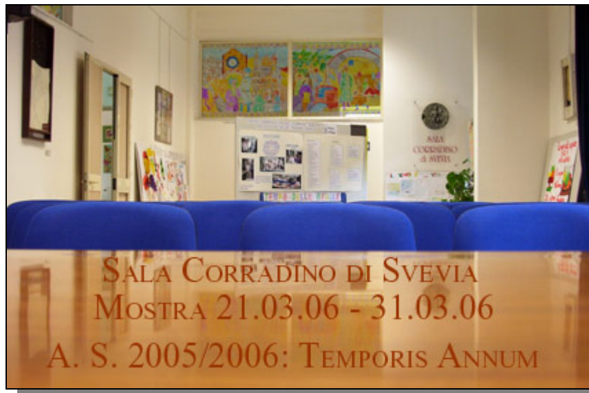
Parte 2 a